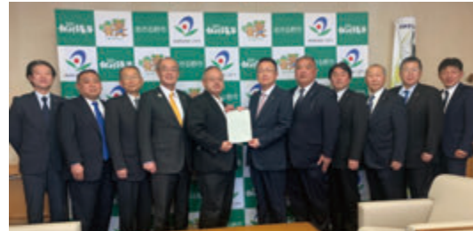
頂いた声を農業要望として会派長から市長に提出 (中央左:会派長/中央右:市長)